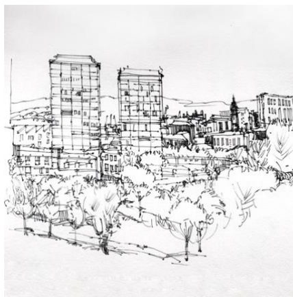
Liz Reid, Glasgow - Ecosse