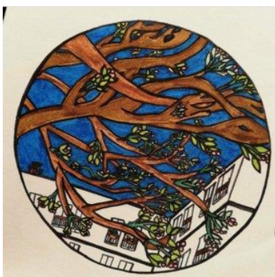
Agath, Paris – France